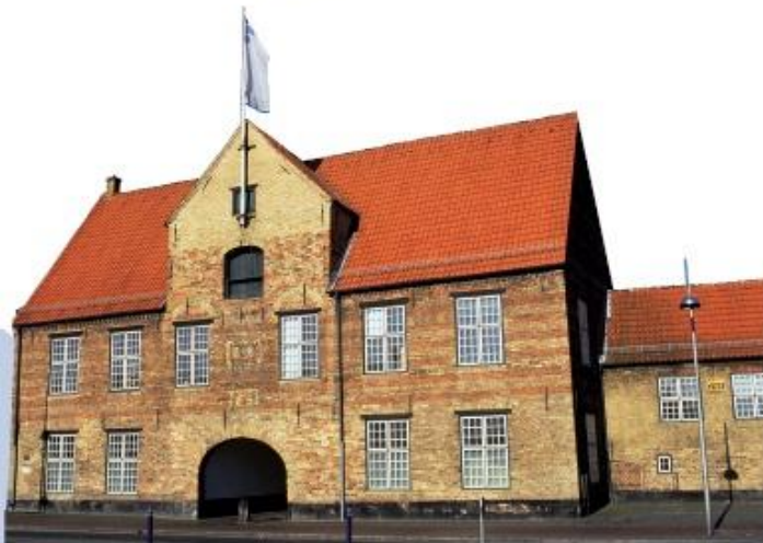
Minderheiten in Europa